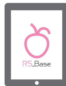
RS_Base / 電子カルテなど